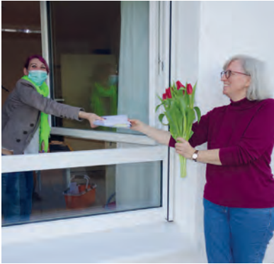
Seelsorge am Fenster