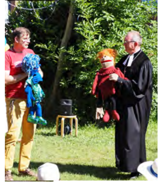
Gottesdienste im Freien