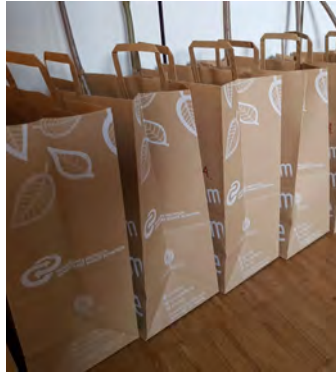
Kindergottesdienst zum Mitnehmen